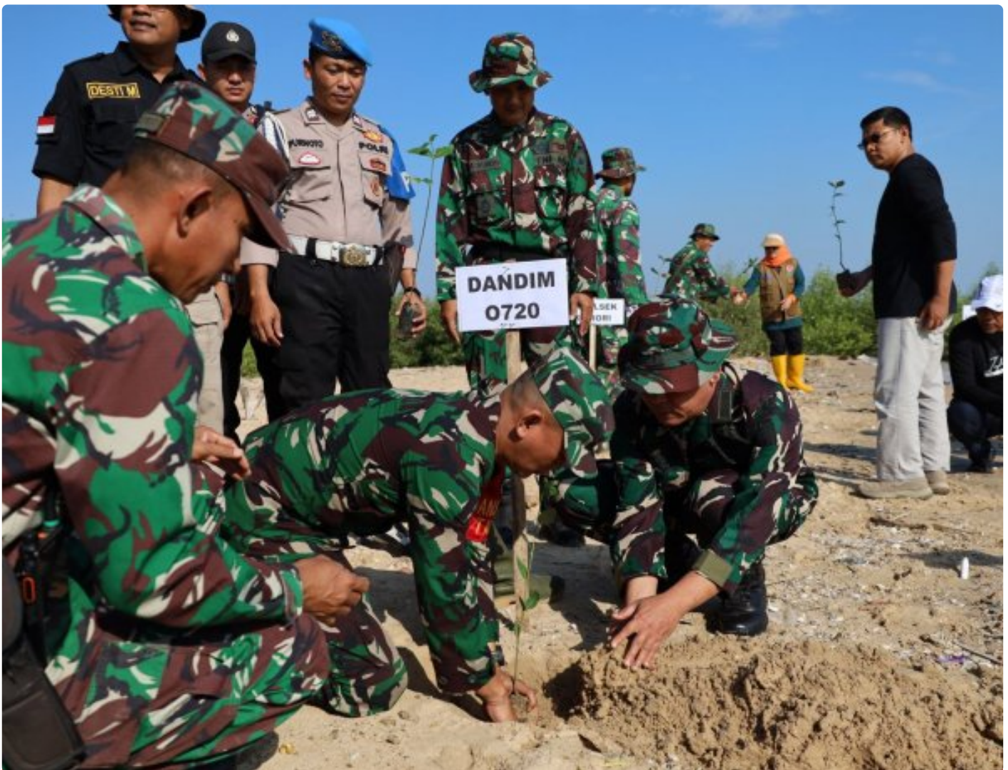
Foto: Satgas Program TNI Manunggal Membangun Desa (TMMMD) Reguler 121 Kodim 0720/Rembang Melaksanakan Kegiatan Reboisasi di Sejumlah Wilayah Kabupaten Rembang, Jawa Tengah, Minggu (11/8/2024).