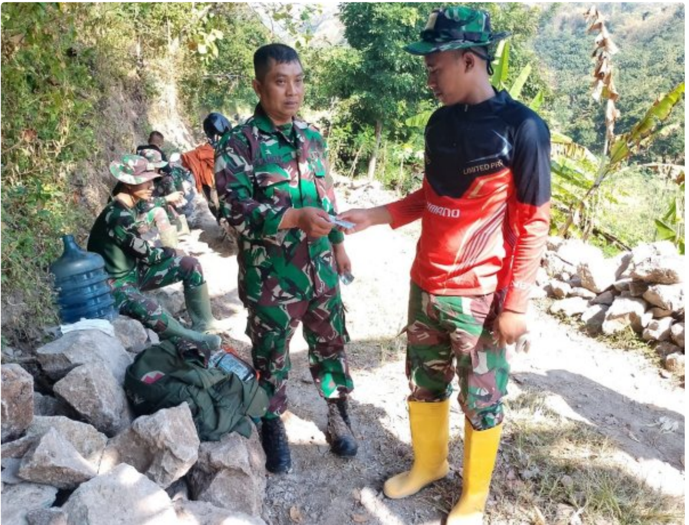
Foto: Anggota Satgas TMMMD Reguler Ke-121 Kodim 0720/Rembang Rutin Mendapatkan Pembagian Vitamin, Kamis (08/08/2024).