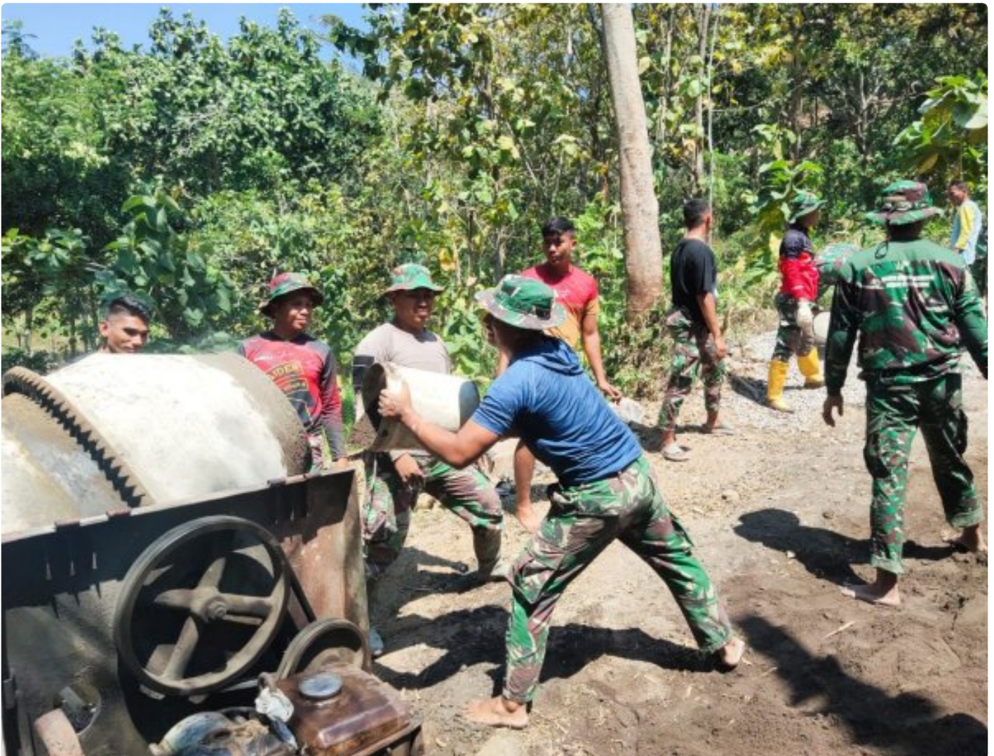
Foto: Anggota Satgas TNI Bersama Masyarakat Desa Labuhan Kidul Membuat Adonan Cor Dalam Betonisasi Jalan Desa Setempat Secara Estafet, Senin 19 Agustus 2024.

REMBANG- Betonisasi jalan merupakan salah satu fokus utama proyek