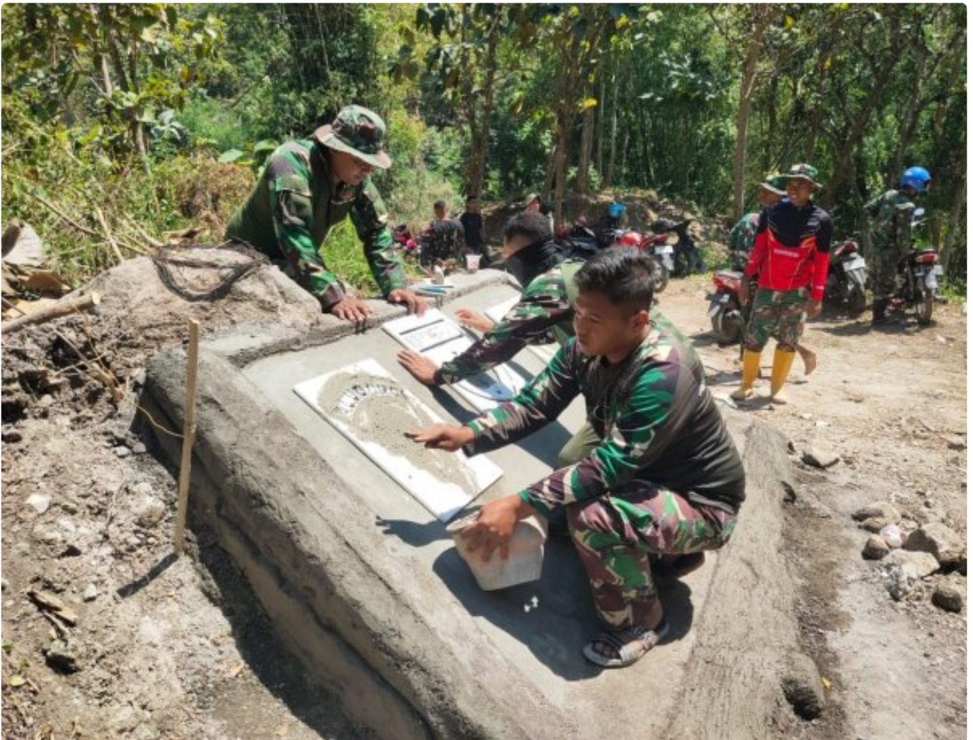
Foto: Pembuatan Prasasti Program TMMD Reguler ke-121 Kodim 0720/Rembang Sudah Mulai Dibangun di Dusun Pilang Kecamatan Sluke Kabupaten Rembang Jawa Tengah, Kamis (15/8/2024).

REMBANG- Satgas TNI Manunggal Membangun Desa (TMMD) Kodim