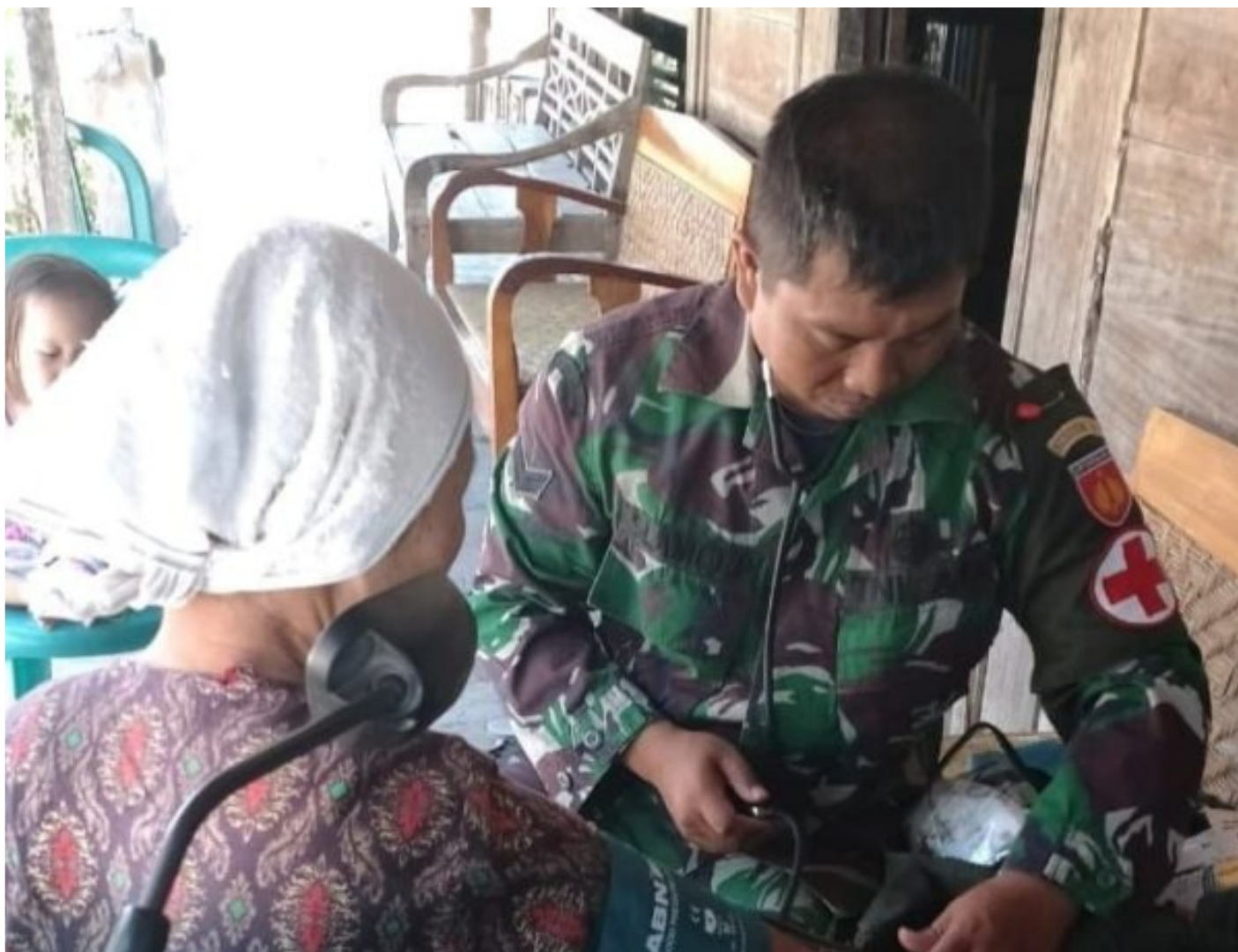
Foto: Sertu Selamat Tenaga Kesehatan TMMMD Reguler ke-121 Kodim 0720/Rembang Melaksanakan Pengecekan Kesehatan Salah Satu Warga Labuan Kidul Kecamatan Sluke Kabupaten Rembang, Jawa Tengah, Senin (19/8/2024).